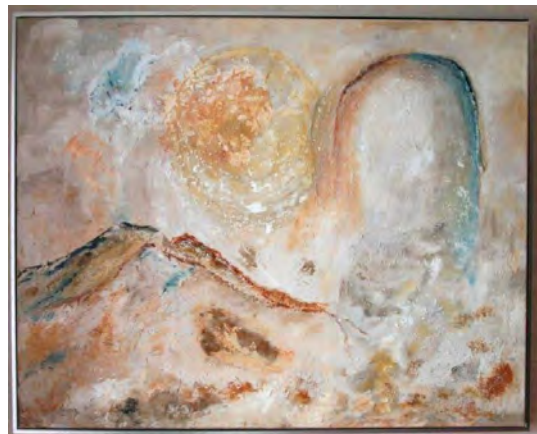
Apennijns droombeeld, 2009